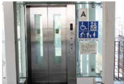
②北口すぐ右手のエレベーター (A) に乗り、1階へ降ります