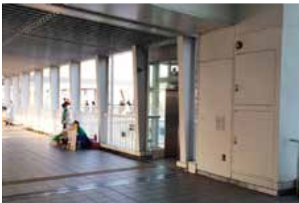
①JR辻堂駅 東改札を出て、左手北口に向かいます