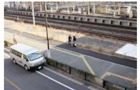
③1階に降り、左前の歩道と車道の防護柵が切れた場所が無料シャトル便乗り場です